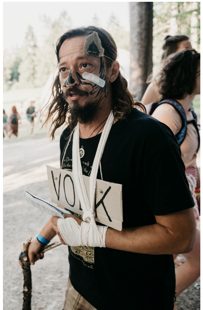
Igrajo: Gledališko-aktivistična skupina Transformator. Dolžina predstave: 60-90 minut oz. po dogovoru.

Pravljичni junaki iz knjižnih platnic so vsem znani. Njihove enoznačne črno-belosti so preproste; v pravljicah je dobro prav in slabo narobe. Njihov enostavni svet je drugačen in tuj našemu sivemu vsakdanjiku. Kaj pa bi se zgodilo, če bi pravljичni liki slekli svoja junaštva in se podali v danes? Bi še vedno princ reševal princeso, ali pa bi bila princesa tista, ki bi vzela zadeve v svoje roke? Bi volk v odškodninski tožbi pravdal Rdečo kapico za svoje podplutbe? Kako bi se čarovnica v svoji koči iz medenjakov spoprijemala z birokracijo skrbništva in rejništva? KUD Transformator popravlja pravljice in prinaša po-pravljice!